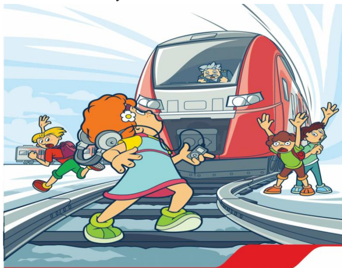
Плеер и железная дорога - несовместимы!